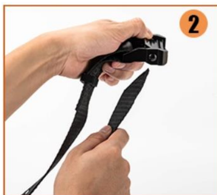
2. Připravte si přezku k popruhu