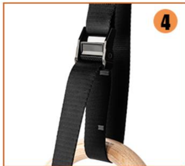
4. The force point is on the bottom metal of the buckle