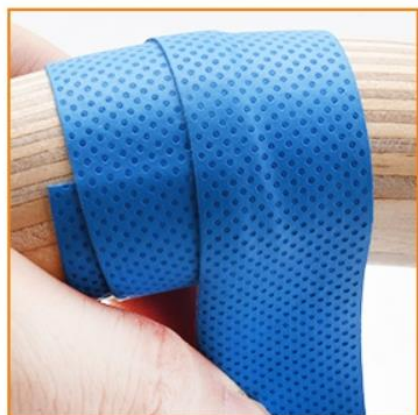
A) Opatrně a pečlivě a nalepte černou pásku okolo kruhů.