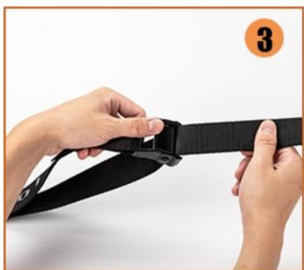
3. Popruh protáhněte přezkou ve správném směru viz obrázek č.3