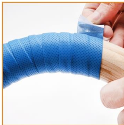
B) Fix the ends of the tapes with the double-sided glue on it.