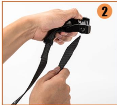
2. prepare the buckle and strap