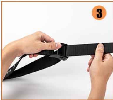
3. Strap starts from the bottom metal and through the metal