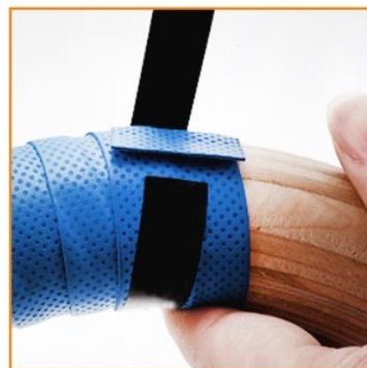
C) Konce pásky zajistěte ještě černou páskou