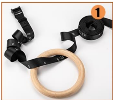
1. Protáhněte popruh gymnastickým kroužkem