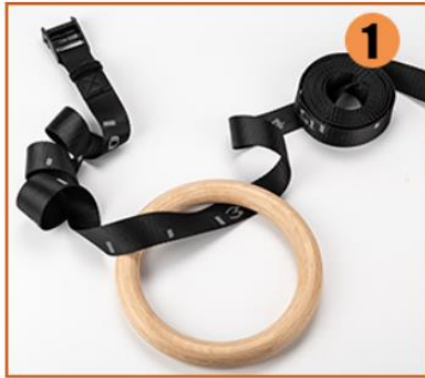
1. Feed the strap through the ring