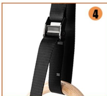
4. Zátěžový bod je na spodní straně spony