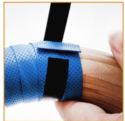
C) If you want to wrap the tapes tighter, you can fix them with our black stickers, too.